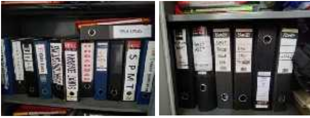
Gambar Berkas dokumen-dokumen yang tersimpan sesuai dengan klasifikasi dan kategori

Dari gambar di atas terlihat berkas dokumen yang telah disimpan berdasarkan klasifikasi dan kategori sesuai dengan format yang telah ditentukan oleh sehingga memudahkan untuk pencarian dokumen yang dibutuhkan.