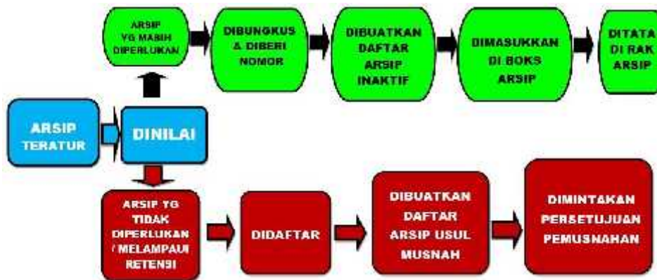
Gambar Alur Proses Penciptaan dan Penerimaan Arsip di Kantor Camat Kecamatan Sako Palembang

Dari gambar di atas terlihat Alur Proses Penciptaan dan Penerimaan Arsip yang berlaku di Kantor Camat Kecamatan Sako Palembang dan telah diterapkan oleh pegawai.