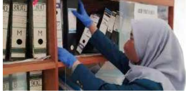
Gambar Proses Pemeliharaan Arsip yang ada di Kantor Camat Kecamatan Sako Palembang

Dari gambar di atas terlihat salah satu pegawai sedang melakukan pembersihan dan penataan ulang arsip, agar dapat tertata dengan rapi.