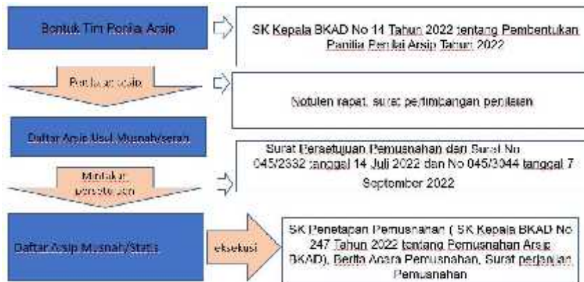
Gambar Alur Tahapan Pemusnahan/Penyerahan Arsip

Dari gambar di atas terlihat alur tahapan pemusnahan arsip sesuai dengan SOP yang telah ditentukan oleh Dinas Kearsipan.